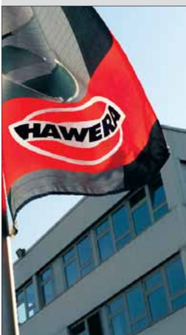
Die Hawera Probst GmbH hat ihren Firmensitz in der Schützenstraße 77 in Ravensburg.

Über 2000 Positionen umfasst der Bestellnummernindex im rund 250 Seiten umfassenden Programmekatalog von Hawera.